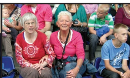
'Omgaan met Linda verrijkt mijn leven'