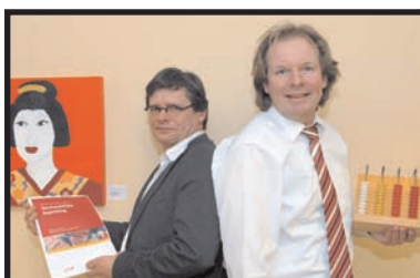
'De Zijlen is financieel gezond' 3