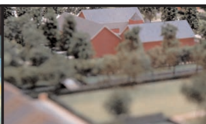
'Nieuwbouw Sintmaheerdt van start!' 8